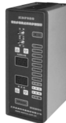
图一、 KD7328 控制器

本控制器的高度集成化,尤其是 I 2 C 总线和数字显示技术的应用,使得电路十分简洁。便于产品的调整、维护和保养。