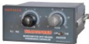
图一 KD7351 (内置电位器)